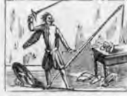
Con rizados golpes de espada prueba la dura celada.