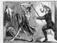
A unos pellejos vacíos embiste con grandes bríos.