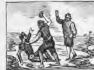
Caminando por un prado por Cardenio es maltratado.