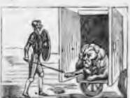
A un león enfurecido sin temor ha acometido.