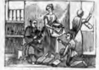
Cuando veía un podía registrara su librería.