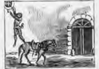
A D. Quijote colgado de una ventana han dejado.