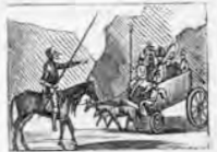
A toda una compañía de cómicos, desata.