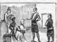
A D. Quijote enseñada es la cabeza encantada.