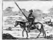
Continuando sus locuras sale en busca de aventuras.