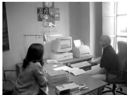
El despacho de la AIH