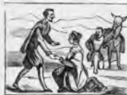
D. Quijote por princesa la toma, y sus plantas besa.