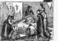
Una corta enfermedad le lleva a la eternidad.