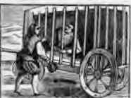
Es D. Quijote encantado y en una jaula encerrado.