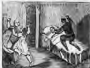
De Maritorres prendado es D. Quijote aporreado.