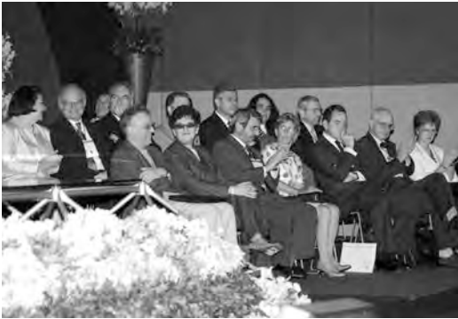
Hispanistas en el acto inaugural