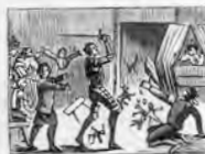
Hiere D. Quijote fiero a un pobre titiritero.