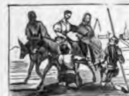
Creyendo ser Dulcinea aúte una moza se apea.