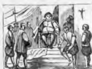
De una isla gobernador hace a Sancho su señor.