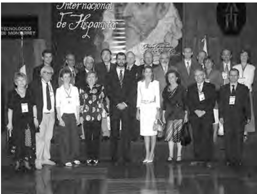
Primer Congreso de los Presidentes de las Asociaciones Nacionales de Hispanistas