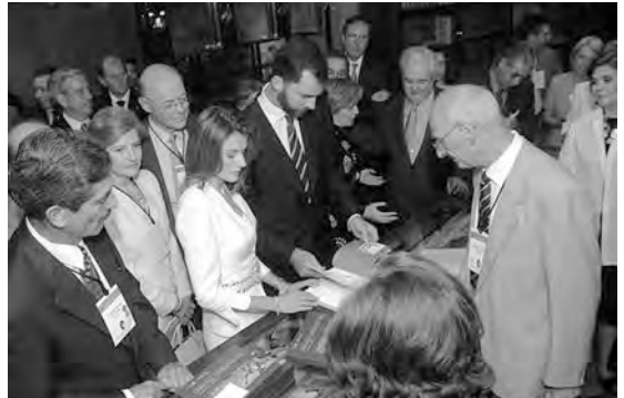
Visita de la exposición de ediciones de Quijotes de la Biblioteca Cervantina del Tecnológico de Monterrey