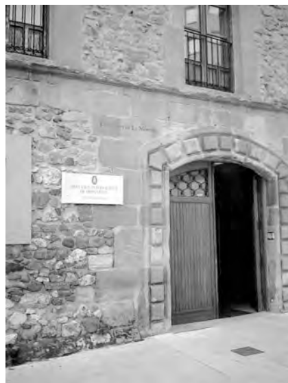
El convento de La Merced

También puede ser que en su archivo personal hayan guardado los socios alguna documentación (cartas, circulares, fotos –sólo se conservan dos fotos!–, carteles, correos electrónicos, etc.) sobre los congresos en que participaron; aquellos que acepten entregar copias u originales a la AIH, con mucho interés la incorporará ésta en su archivo 2 .