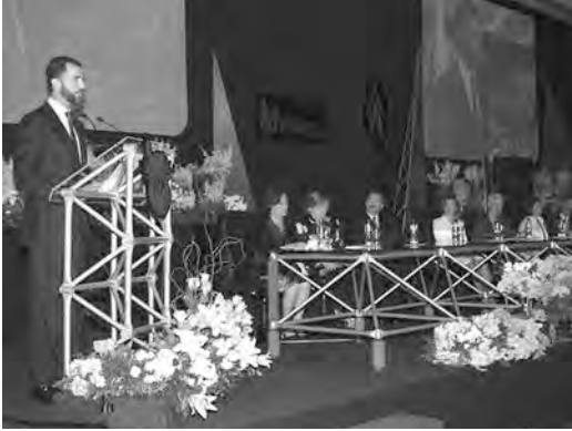
S.A.R. el Príncipe de Asturias en el discurso inaugural