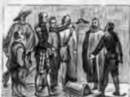
La bacía, el yelmo fino disputa ser de Mambriño.