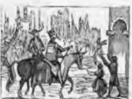
Cuando en Barcelona entraron los moriscos los silvan.