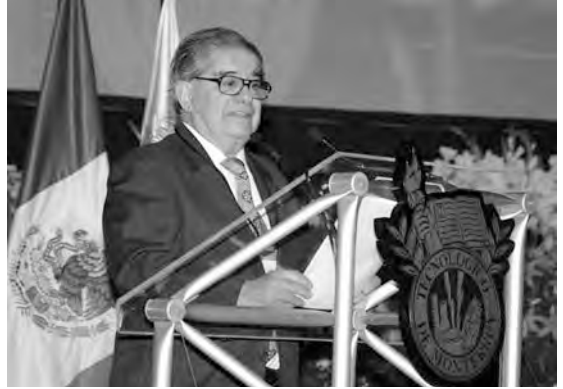
Conferencia magistral De Miguel León Portilla