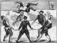
Como un pelele tomado es el buen Sancho manteado.