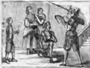
Por el mismo resonero es armado caballero.