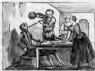
Por la cebada con maña bebe el agua en una caña.