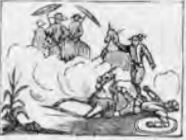
De un mercader el criado a D. Quijote ha tirado.