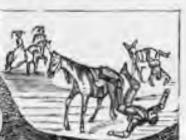
Tan vergonzosa caida solo a la ciegos es debida.