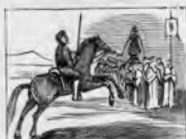
El valiente campeón dispersa una procesión.