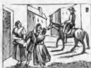
A su pueblo al fin regresa porque la edad y la pesa.