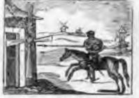
A unos molinos de viento embiste con ardimiento.