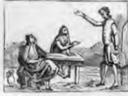
Con el barbero y el cura disputa ya su su locura.