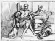
Es curioso y divertida de D. Quijote la vida.