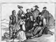
Asisten sin gran empacho a las bodas de Camacho.