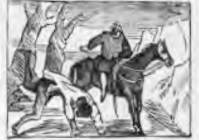
De Dulcinea en la ausencia se pone a hacer penitencia.