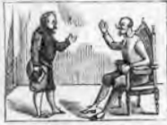
De escudero a Sancho Panza recibe con confianza.