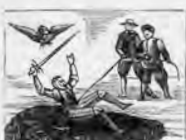
De Montesinos la cueva a recorrer solo, prueba.