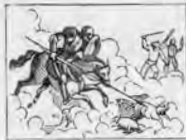
Ataca ciego a un rebaño produciendo mucho daño.