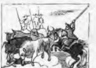
Unos toros le acometan y su vida comprometen.