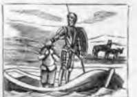
Quiere con Sancho embarcarse con gran peligro de ahogarse.