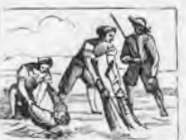
Del molino los criados los sacan ya medio ahogados.