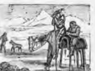
Duerme Sancho cansado y su burro le es burlado.