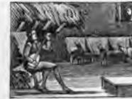
Un mozo de mulas canta de su amor la empresa santa.